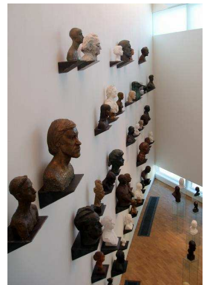
KUMU OSAKAB ÜLLATADA: Pilk ühte näitusesaali, kus suurmeeste pead kõnetasid kunstinautlejaid.

Hea kultuurilaengu andis raamatukoguhoidjaile kui kirjutava kultuuri jüngerile ka kunstitempel KUMU. Toivo Ärtis