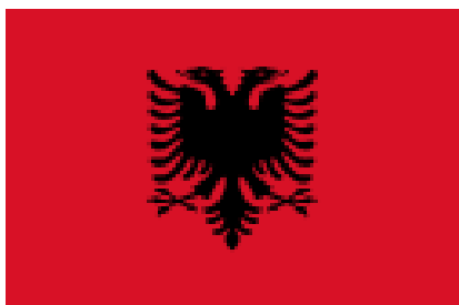
SÜMBOL: Albaania Vabariigi lipul lehvitab punasel taustal tiibu võimas must kahepealine kotkas.

Kotka lapsed – just nii nimetavad end albaanlased, 7-miljoniline rahvas, kellest umbes pooled elavad oma kodumaal Albaanias. Albaania Vabariigi lipul lehvitab punasel taustal tiibu võimas must kahepealine kotkas.